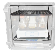
RS2 BS-010425-HK rack per installazione CPS-20 / CTR-6 Rack per installazione CPS-20 / CTR-6