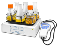
CPS-20 Without platform CO 2 agitatore