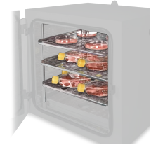
RS6 BS-010425-GK scaffale con 3 ripiani Scaffale con 3 ripiani