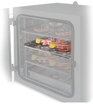
Ripiano aggiuntivo BS-010425-AK