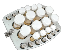
PRS-8/22 BS-010118-AK piattaforma

48 provette con diametro 10-16 mm (provette da 1,5-15 ml)