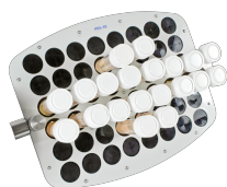
PRS-48 BS-010118-CK piattaforma

14 provette con diametro 20-30 mm (provette da 50 ml)