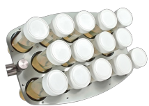
PRS-14 BS-010118-BK piattaforma

14 provette con diametro 20-30 mm (provette da 50 ml)