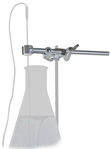
HTP-1 BS-010309-FK supporto

HTP-1, supporto per sonda di temperatura